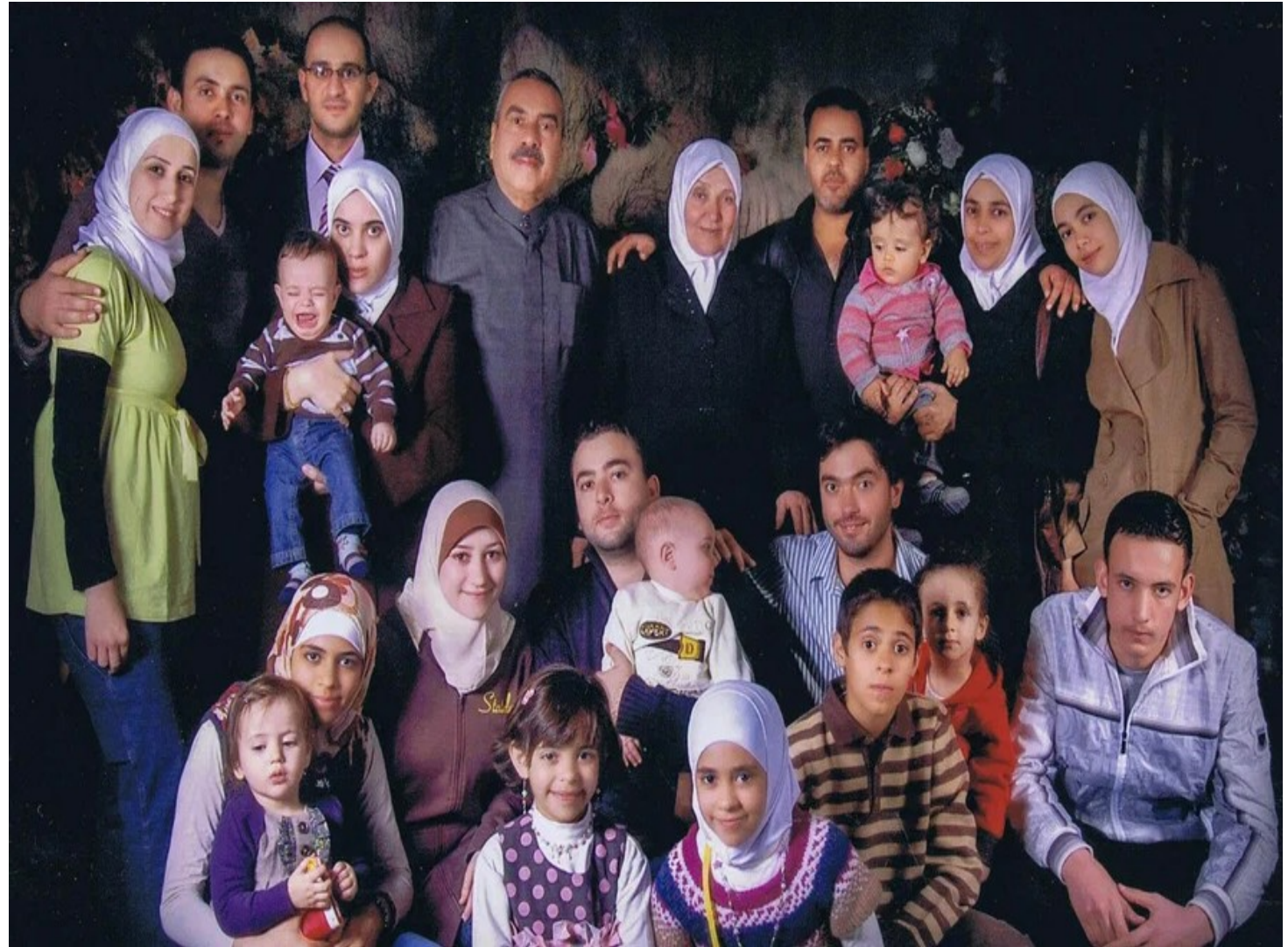
Eine Familie aus dem syrischen Deraa