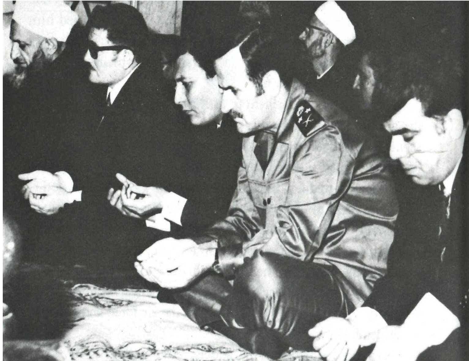
Hafiz al-Assad besucht medienwirksam das Freitagsgebet 1973