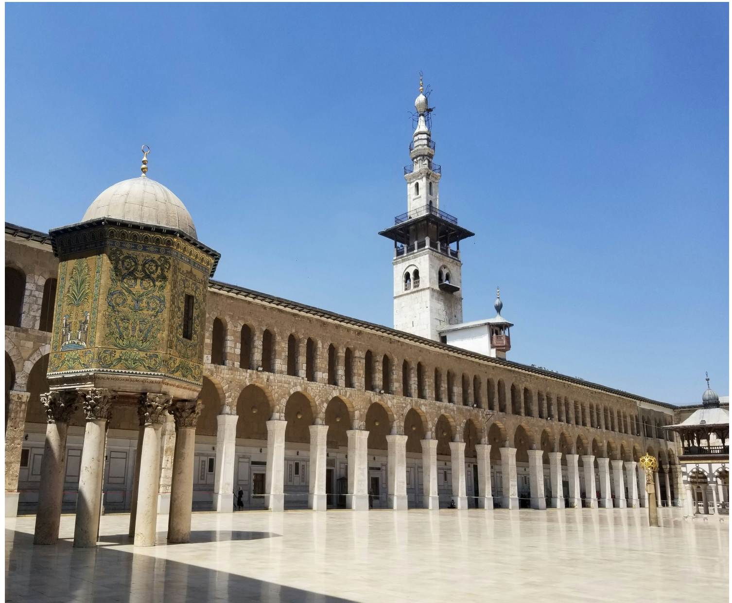
Die Umayyaden-Moschee in Damaskus