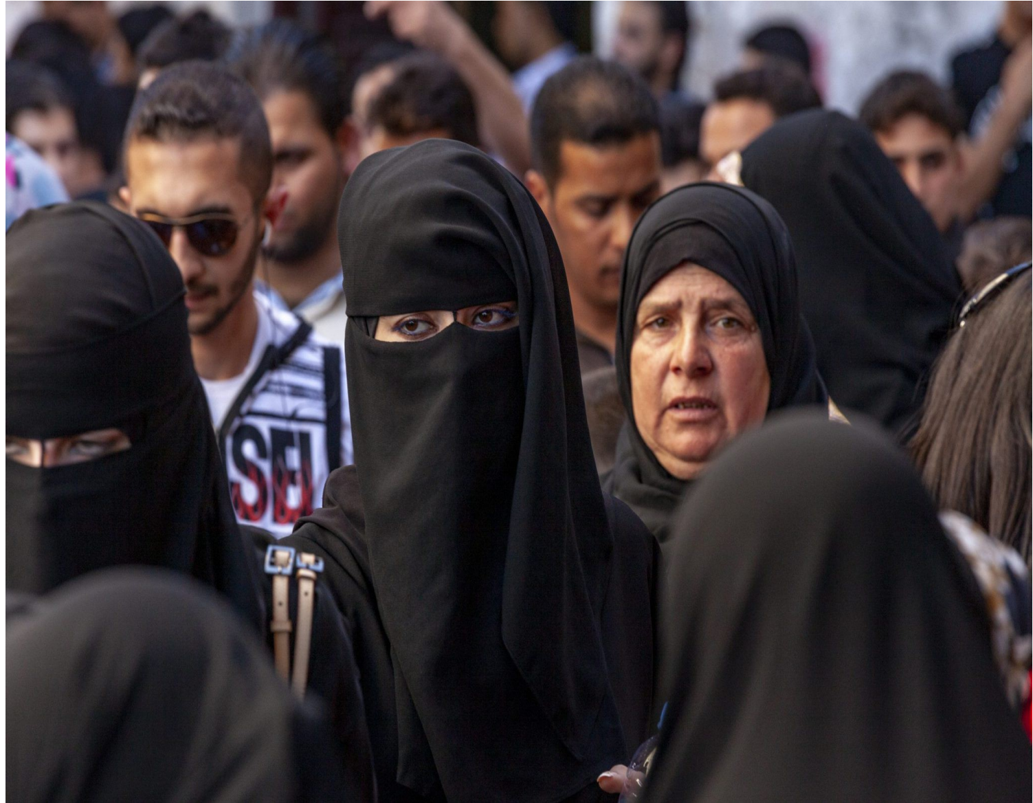
Verschleierte Frauen auf den Straßen von Damaskus 2025