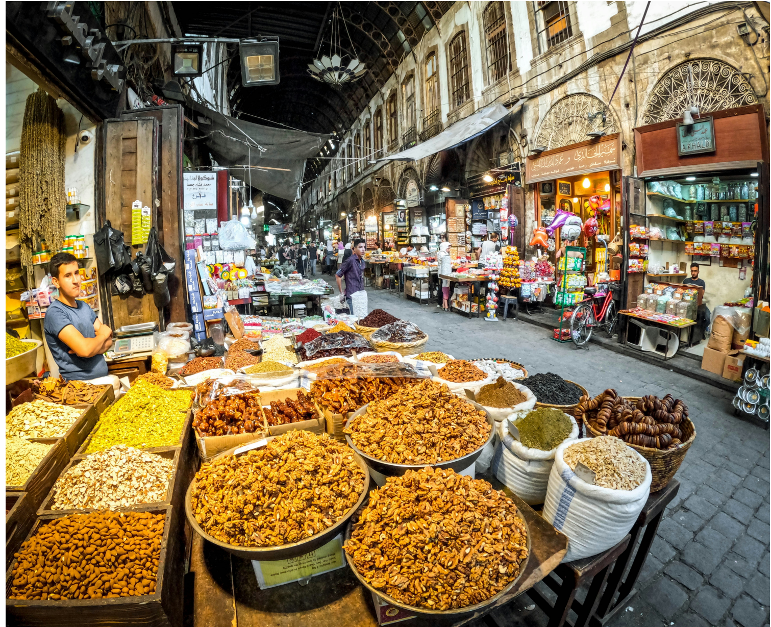
Markt in der Altstadt von Damaskus