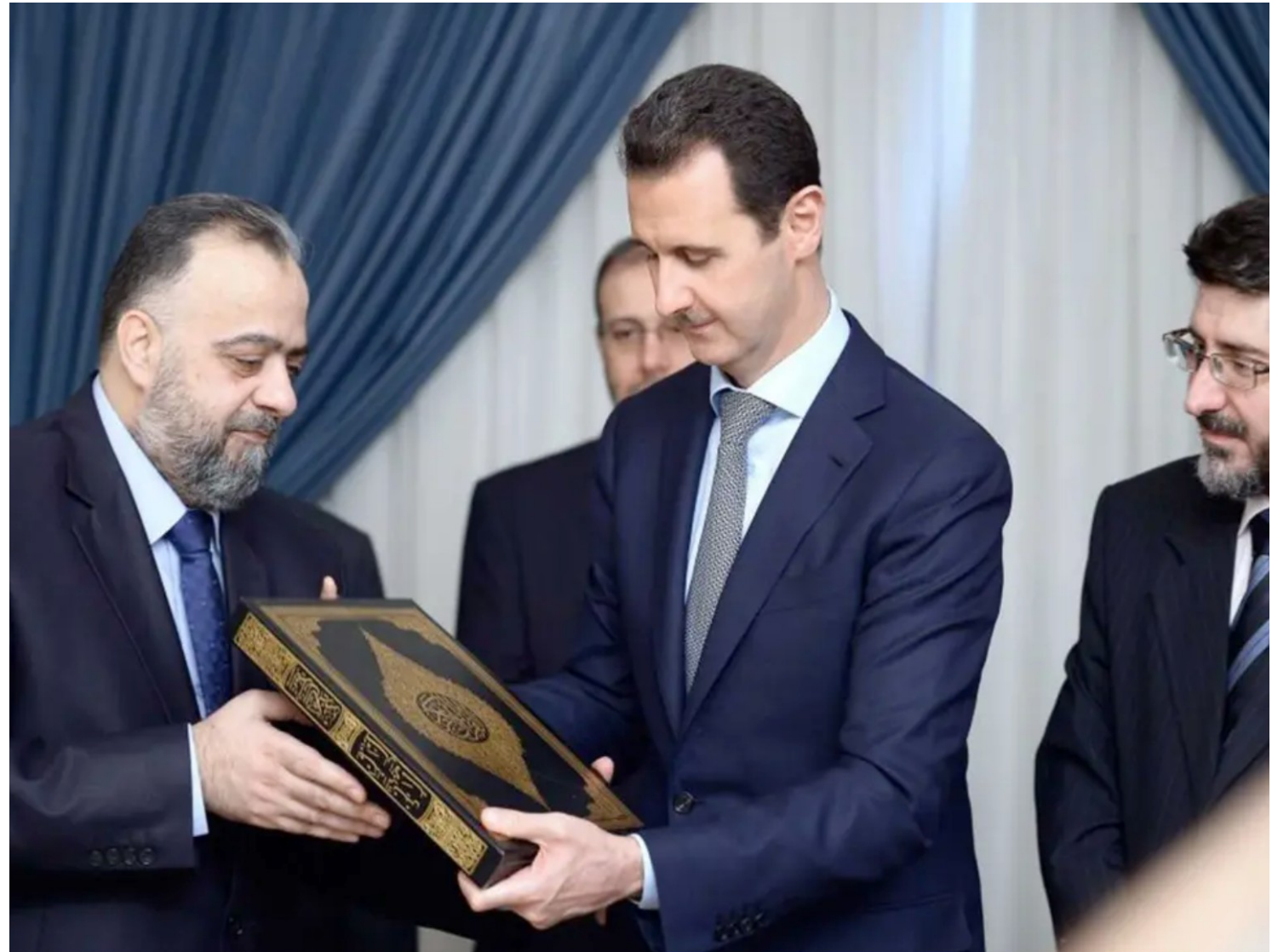
Baschar al-Assads Herausgabe der neuen Standardausgabe des Korans für Syrien im Juli 2015