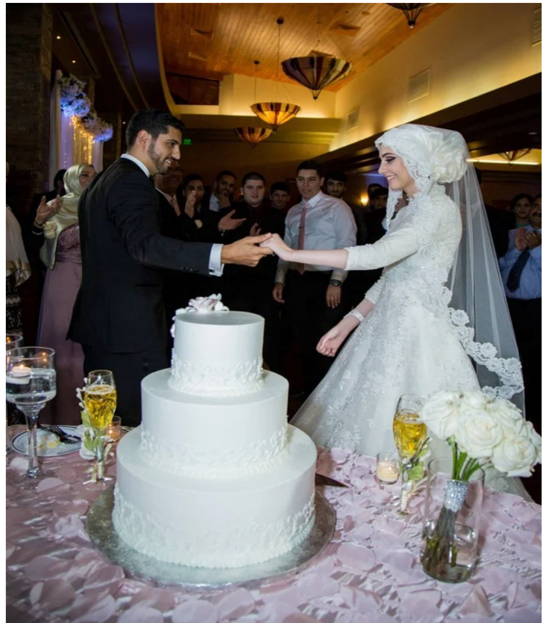
Syrische Hochzeit in Hama