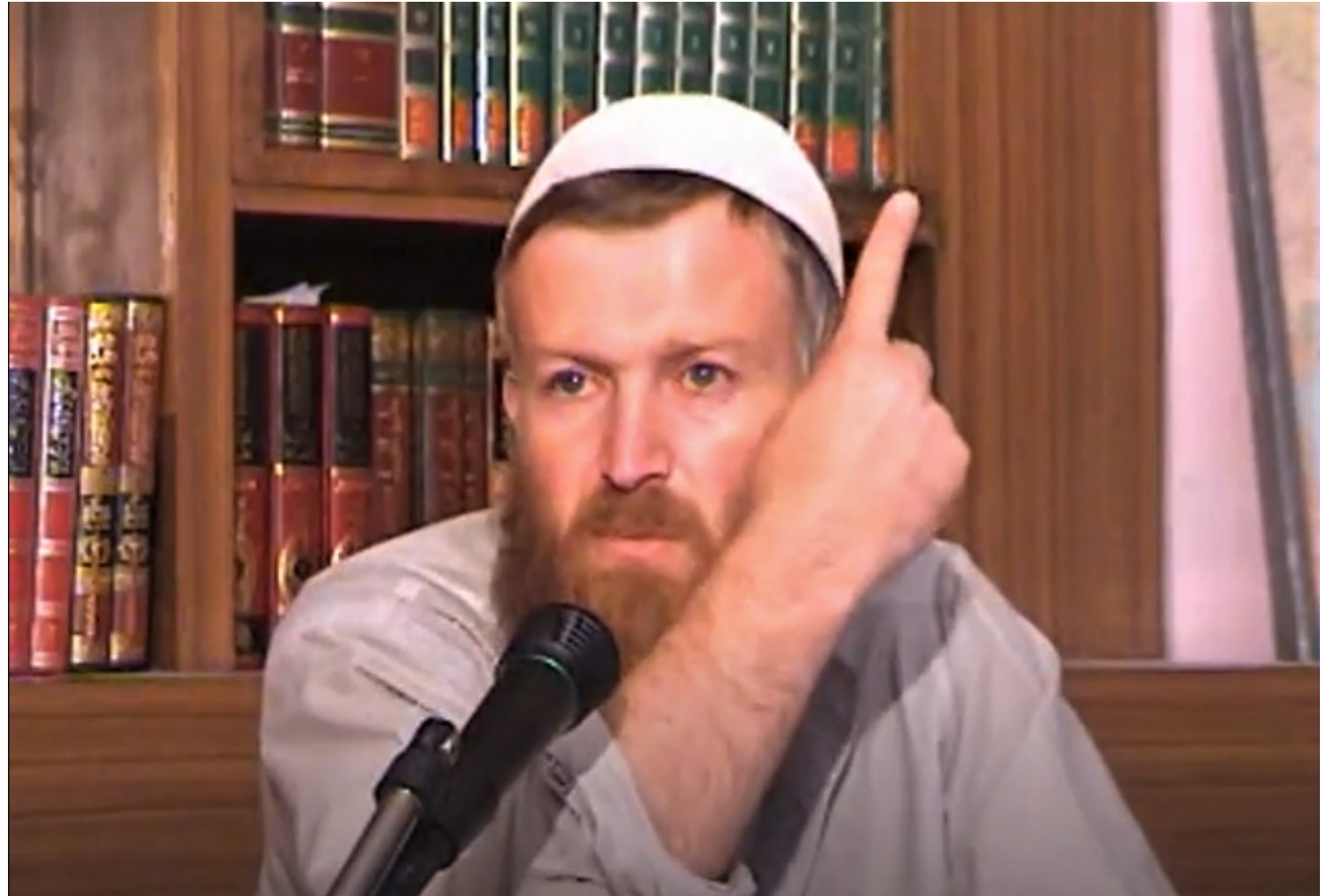
Abu Musab al-Suri in einem Dschihad-Lehrvideo