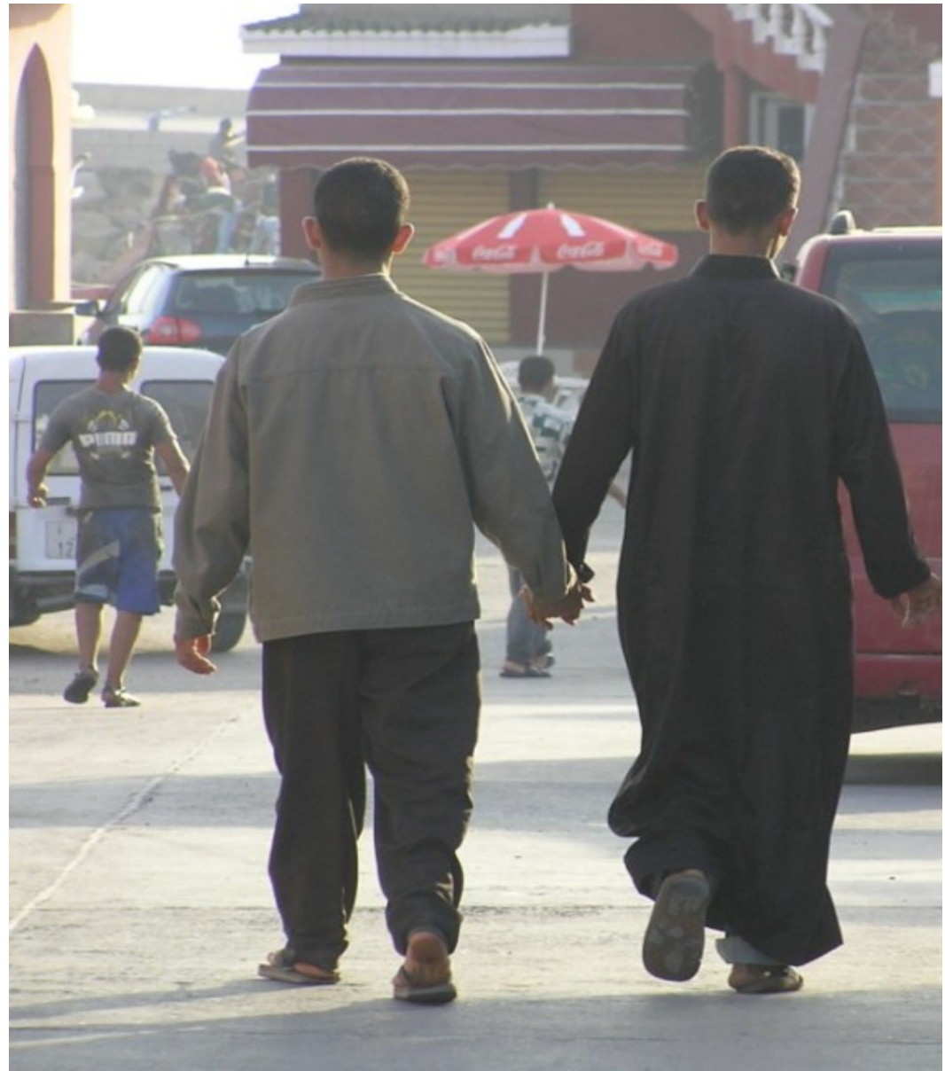
Arabische Männer halten Händchen auf der Straße