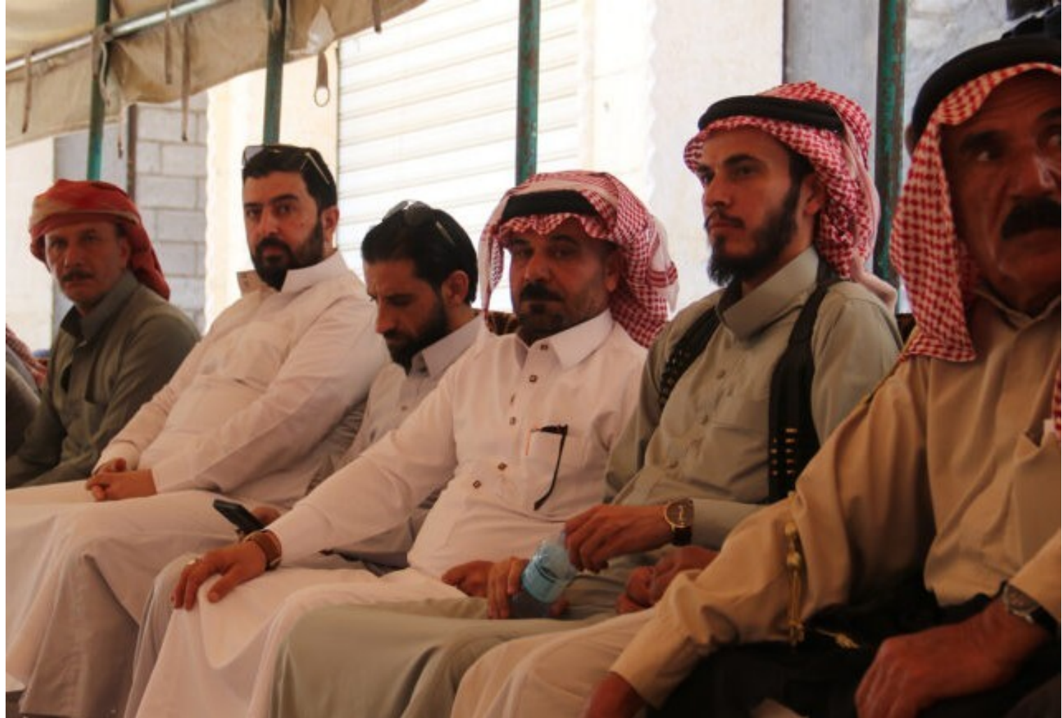
Stammesversammlung im syrischen Hassakeh