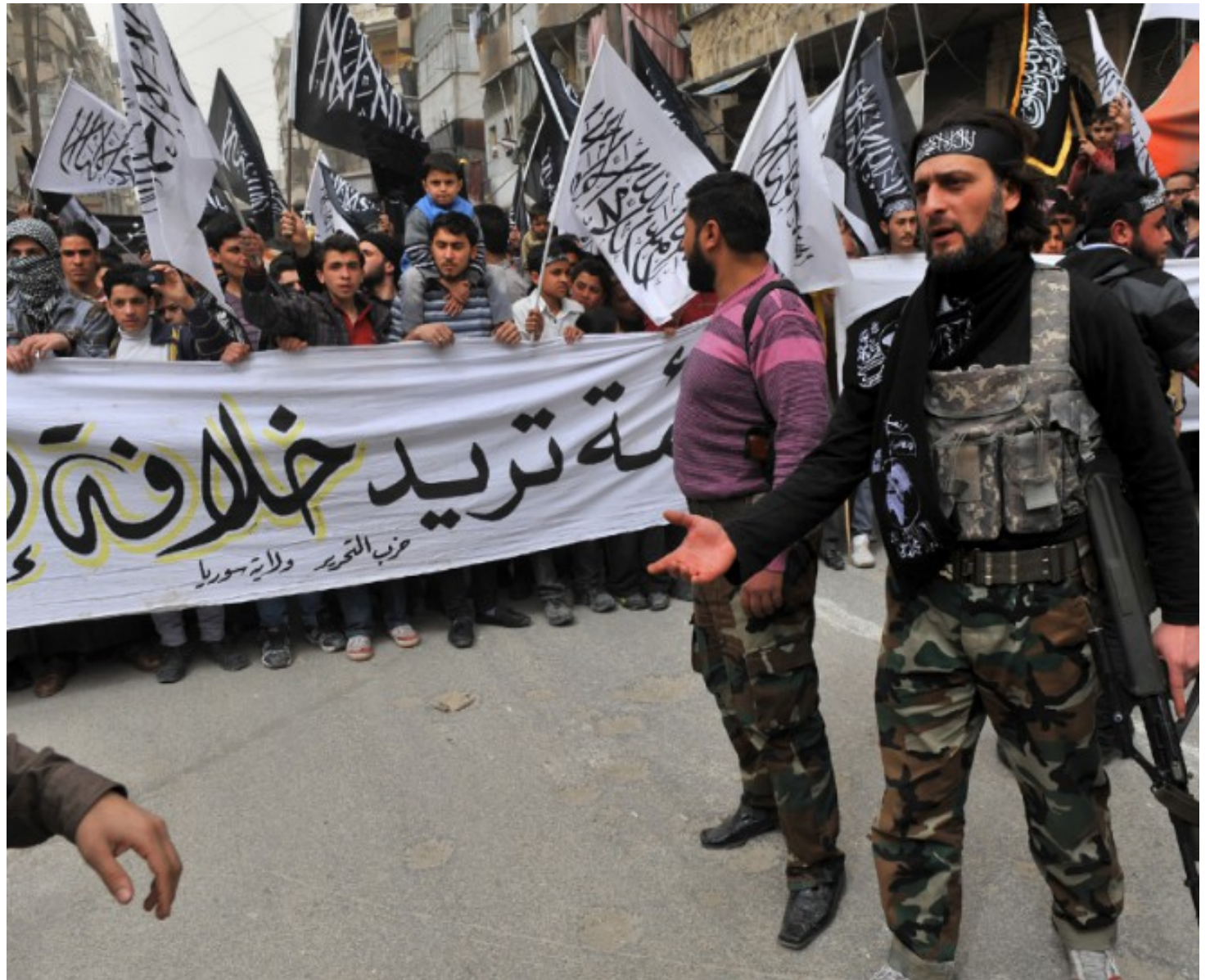
Demonstration syrischer Oppositionsbündnisse in Aleppo Anfang 2013