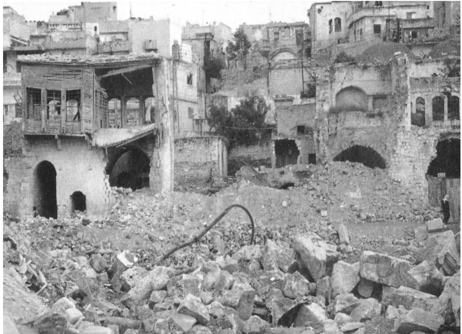
Zerbombter Straßenzug in der Stadt Hama 1982